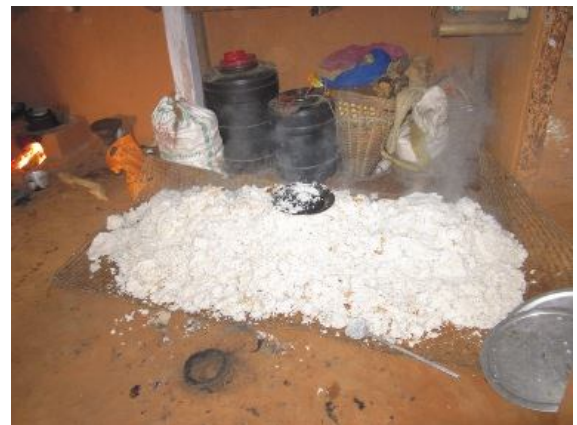
En dampende haug med ris på en matte på jordgulvet

Mye ris skulle til når Visjonskirken ble virkelighet og hele bygda og nabomenigheter skulle feste og bispises.