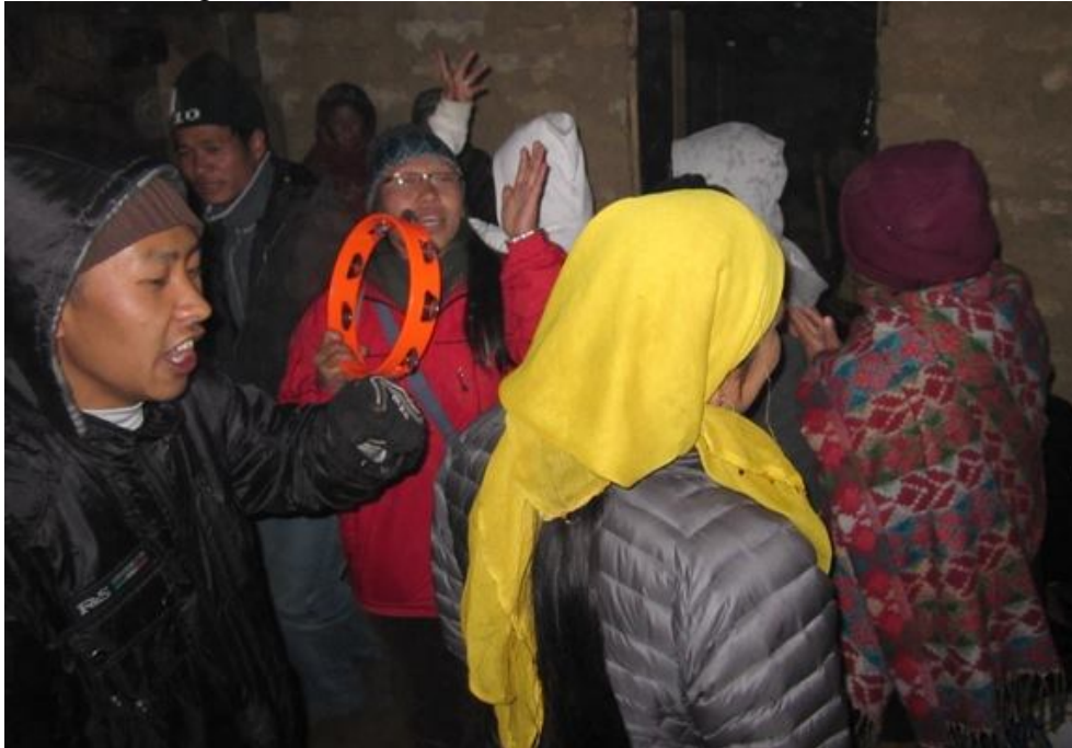
Sang, dans, trommer og tamburin varmet og gledet oss alle.

Den siste vinterdagen dette året, i sterkt regn, la vi i vei med leid bil, noen på motorsykkel og noen på raske føtter. Vi var 22 fra menigheten herfra som kom oss opp. Vi ba om godt vær, men det fikk vi ikke. Men vi fikk noe mye bedre! Det var så kaldt at vi holdt oss tett sammen og danset og sang så blodet boblet og varmen kom. Det var et slikt uvær så vi ble værfaste der oppe. Med sjåfør og hjelpegutt var vi 24 stykker som sov i det nye oppholdsrommet hennes! Det var vel en skikkelig innvielse?