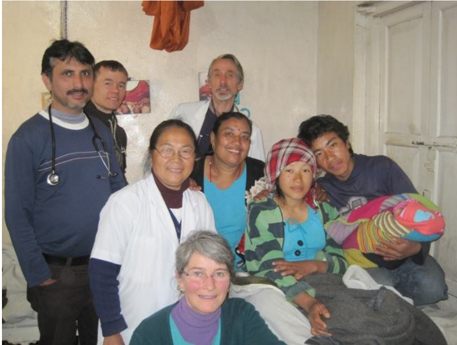
The Winning Team!

Det er ekstremt alvorlig for begge, selv på moderne sykehus i Norge. Men denne gangen gikk det bra, fordi vi fikk barnet så fort ut. Takket være mødreventehjemmet, ellers hadde hun hatt syv timers gange til sykehuset! Det kan gå fort på et lite sted der alle kjenner hverandre, og sin egen oppgave. Så ting kan startes på et øyeblikk når det trengs. Noen som ønsker å komme hit for å føde?